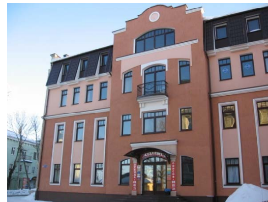
Головной офис (г. Смоленск)