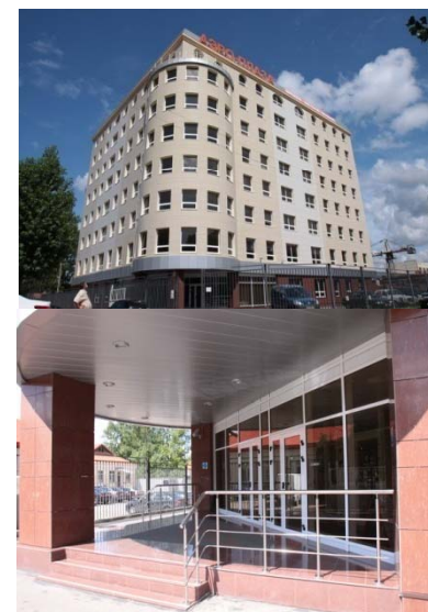
Доп. офис (г. Химки)